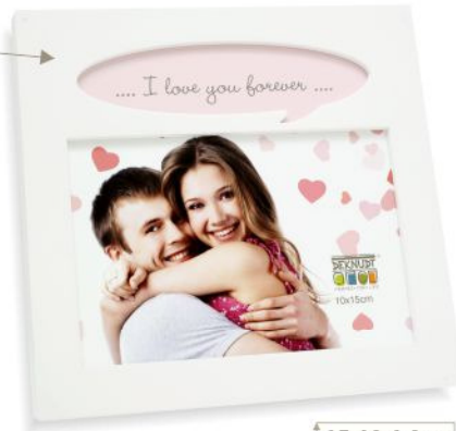
S68LK1 E2T 10x15

Schrijf hier uw eigen tekst Ecrivez ici le texte de votre choix Schreiben Sie hier Ihren eigenen Text Write here the text of your choice