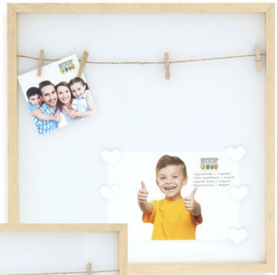
S68LH1 EA 30x30 (6 magn.)