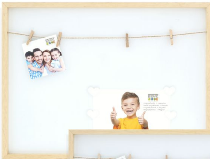
S68LH1 EB 30x40 (6 magn.)