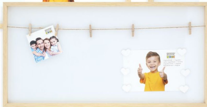
S68LH1 EC 25x50 (6 magn.)